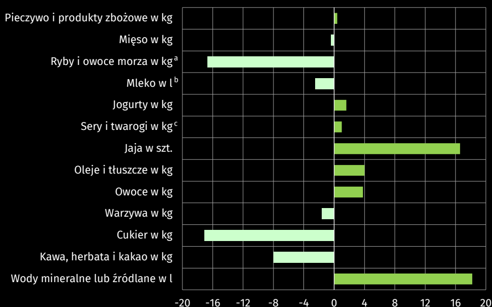
Wykres 3. Odchylenia względne przeciętnego miesięcznego spożycia wybranych artykułów żywnościowych na 1 osobę w gospodarstwach domowych od przeciętnego miesięcznego spożycia w kraju w 2023 r. Polska=100

a Bez marynat, przetworów ze zwierząt morskich i słodkowodnych, wyrobów garmażeryjnych i panierowanych, bez konserw rybnych. b Bez zagęszczonego i w proszku. c Bez słodkich serków.