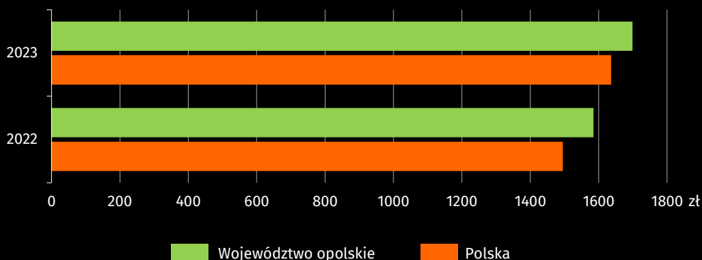
Wykres 1. Przeciętne miesięczne wydatki na 1 osobę w gospodarstwach domowych

Podobnie jak przed rokiem najwyższy udział w strukturze wydatków ogółem gospodarstw domowych miały wydatki na żywność i napoje bezalkoholowe – 27,1% (w kraju – 27,2%). Kolejną znaczącą grupą wydatków były opłaty ponoszone przez gospodarstwa z tytułu użytkowania mieszkania lub domu i za korzystanie z nośników energii – 18,3% (w kraju – 19,9%), a w dalszej kolejności wydatki na transport, które stanowiły 8,2% (w kraju – 9,0%). Najmniej środków finansowych, zarówno w województwie jak i w kraju, gospodarstwa przeznaczyły na edukację.