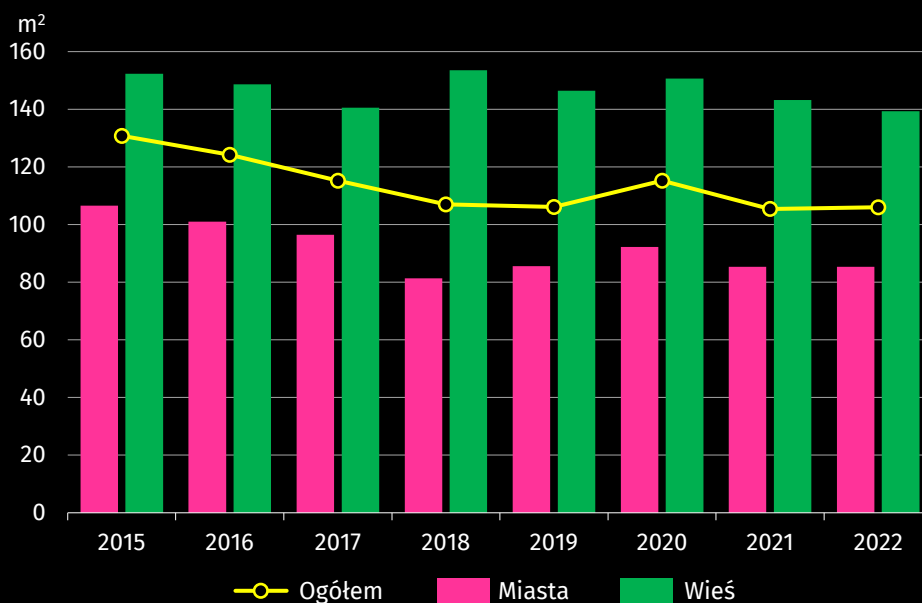
Wykres 1. Przeciętna powierzchnia użytkowa 1 mieszkania oddanego do użytkowania

Łączna powierzchnia użytkowa mieszkań oddanych do użytkowania w województwie opolskim w 2022 r. wynosiła 349,4 tys. m 2 . Przeciętna powierzchnia użytkowa jednego mieszkania wynosząca 106,0 m 2 (w kraju – 92,3 m 2 ) zwiększyła się w stosunku do roku poprzedniego o 0,6 m 2 , a zmniejszyła się w porównaniu z 2015 r. o 24,8 m 2 (w kraju odpowiednio mniejsza: o 0,6 m 2 i o 7,5 m 2 ). Mieszkanie przekazane do użytkowania w mieście było średnio o 54,0 m 2 mniejsze niż na wsi. Największe mieszkania oddano w budownictwie indywidualnym (przeciętnie 149,3 m 2 ), natomiast najmniejsze w budownictwie przeznaczonym na sprzedaż lub wynajem (68,9 m 2 ).